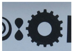
( 12 )