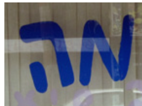
( 9 )