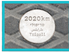
( 1 ) באילוסטרף