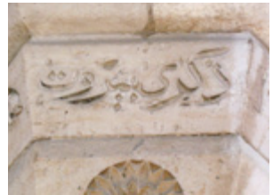
( 8 )