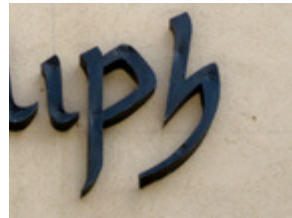
( 5 )