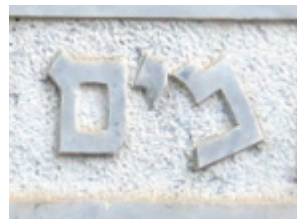
( 10 )