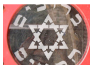
( 16 )