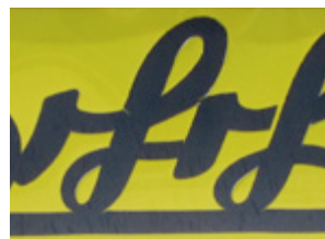
( 14 )