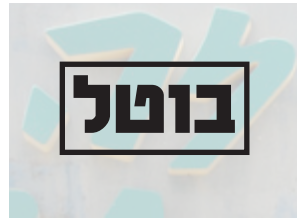
( 6 ) ביאי