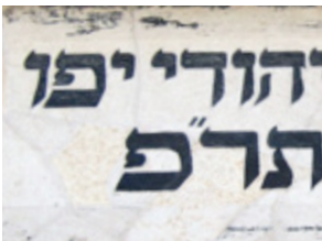
( 11 )