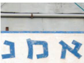
( 19 )