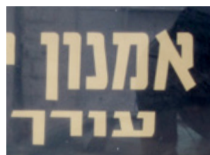
( 18 )