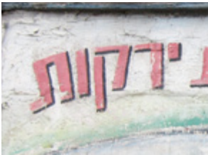
( 7 )