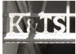
( 4 )