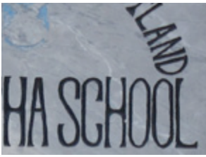
( 3 )