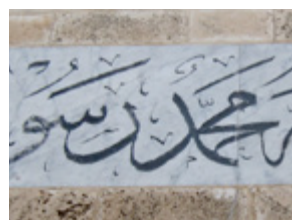
( 17 )