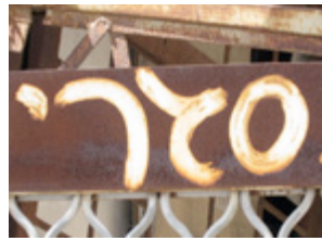
( 2 )